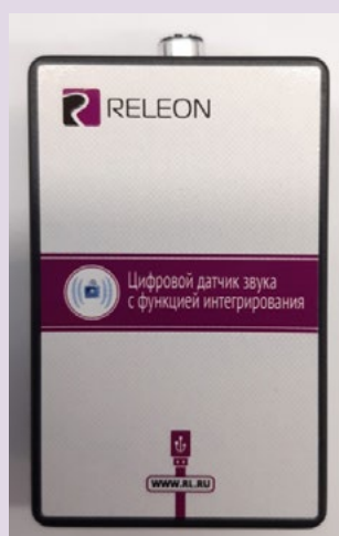
Рис. 7. Датчик звука

Датчик звука — измеряет уровень шумов в окружающей среде и при оценке шумопоглощающих изоляторов. Динамический диапазон: от 30 до 130 дБ. Частотный диапазон: от 50 Гц до 8 кГц. Разрешение: 0,1 дБА (акустические децибелы). Технологические особенности: датчик чувствителен к резким звукам, которые могут дать завышенные результаты измерений.