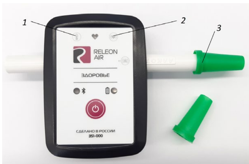
Рис. 3. Мультидатчик по физиологии. Обозначение разъёмов и технологических отверстий: 1 — температура тела, 2 — пульс, 3 — частота дыхания (надет съёмный мундштук)

Мультидатчик по физиологии позволяет определять артериальное давление, пульс, температуру тела, частоту дыхания, ускорение движения (рис 3).