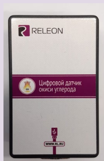
Рис. 11. Датчики кислорода (слева) и угарного газа (справа)