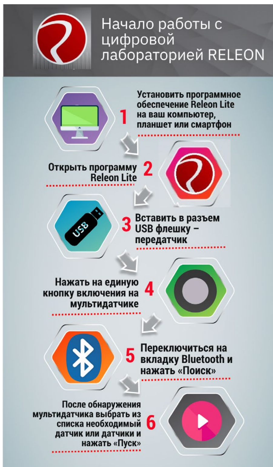
Рис. 14. Алгоритм работы с программным обеспечением Releon Lite

При изучении естественных наук в современной школе огромное значение имеет наглядность учебного материала. Наглядность даёт возможность быстрее и глубже усваивать изучаемую тему, помогает разобраться в трудных для восприятия вопросах, и повышает интерес к предмету.