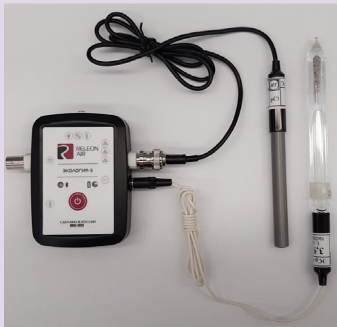
Рис. 10. Ионоселективный датчик (присоединены электро хлорид-ионов и электрод сравнения)

Датчик кислорода — предназначен для определения относительной концентрации кислорода в воздухе. Диапазон измерения: от 0 до 100 %. Разрешение: 0,1 %. Технологические особенности: при измерении содержания газа в выдыхаемом воздухе необходимо держать мембрану максимально близко ко рту; восстановление показаний на воздухе происходит через 1—2 минуты (время диффузии через мембрану).