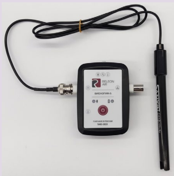
Рис. 5. Датчики электропроводимости

Датчик электропроводимости — предназначен для регистрации и измерения удельной электропроводности жидких сред, в том числе и водных растворов веществ. Применяется при изучении характеристик водных растворов, в том числе почвенных вытяжек.