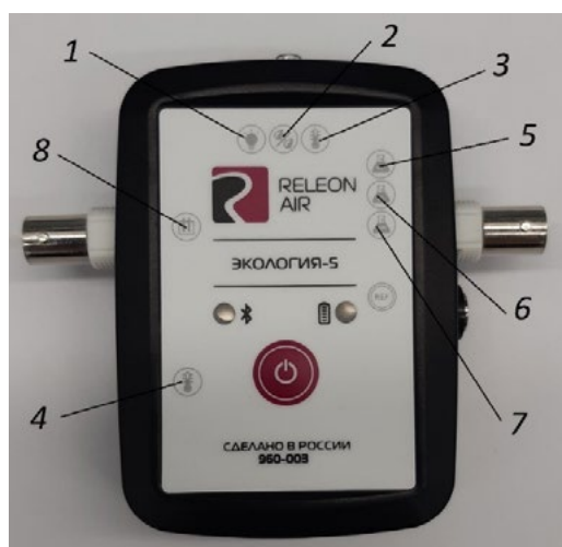
Рис. 2. Мультидатчик по экологии. Обозначение разъёмов и технологических отверстий: 1 — освещённость, 2 — относительная влажность воздуха, 3 — температура окружающей среды, 4 — температура растворов, 5 — нитрат-ионы, 6 — хлорид-ионы, 7 — pH, 8 — электропроводность

Мультидатчик по экологии позволяет измерять следующие показатели: водородный показатель водных сред, концентрации нитрат-ионов и хлорид-ионов, электропроводность, влажность, освещённость, температуру окружающей среды, температуру растворов, растворов и твёрдых тел (рис. 2).