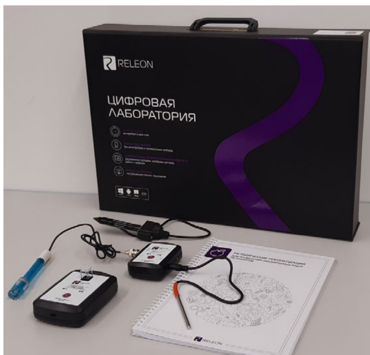
Рис. 1. Цифровая лаборатория

Ниже дана краткая характеристика цифровых датчиков, приведены выявленные на практике технологические особенности применения. Учёт этих особенностей позволит правильно использовать датчики и продлить срок их службы.