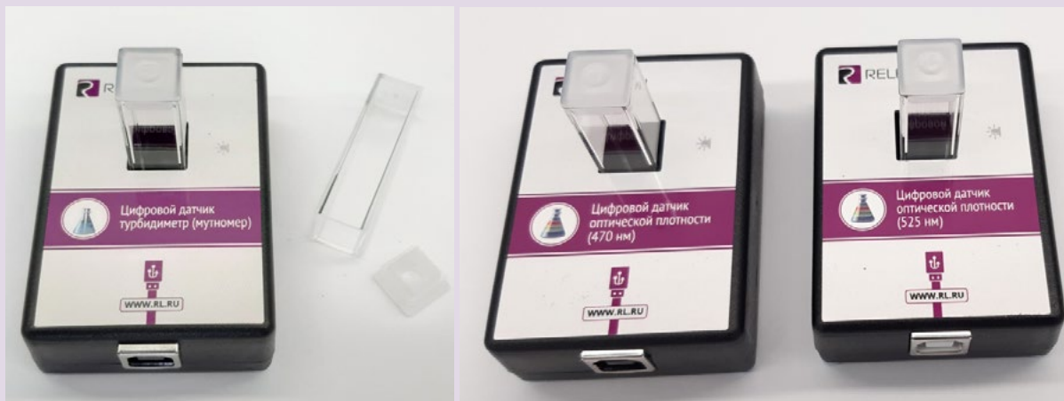
Рис. 8. Датчики мутности (слева), оптической плотности на 465 нм (в центре) и 525 нм (справа)

В комплект входят датчики с различной длиной волн полупроводниковых источников света: 465 и 525 нм. Диапазон измерения коэффициента пропускания света: от 0 до 100 %. Разрешение при измерении коэффициента пропускания: 0,1 %. Диапазон измерения оптической плотности: от 0 до 2 D. Разрешение при измерении оптической плотности: 0,01 D. Длина оптического пути кюветы: 10 мм. Объём кюветы: 4 мл. Технологические особенности: требуется хорошо промывать кювету для исследуемого раствора.