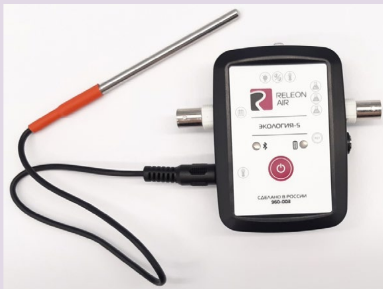
Рис. 6. Датчик температуры растворов

Датчик температуры термопарный предназначен для измерения температур до 900. Используется при выполнении работ, связанных с измерением температур плавления и разложения веществ, а также для измерения температуры в экзотермических процессах.