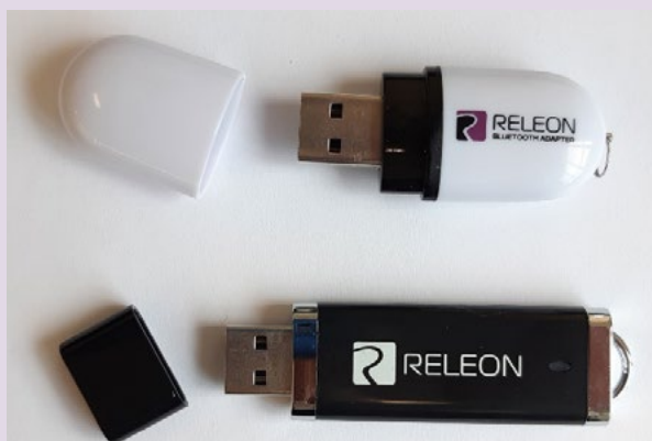
Рис. 13. Общий вид USB-флеш-накопителя (внизу) и Bluetooth-адаптера (вверху) Releon

В комплекте цифровой лаборатории Releon поставляется программное обеспечение Releon Lite на USB-флеш-накопителе, а также Bluetooth-адаптер для связи регистратора данных с беспроводными датчиками (рис. 13).