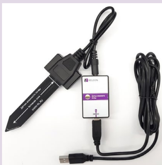
Рис. 4. Датчик влажности почвы

Датчик влажности почвы — предназначен для измерения степени увлажнения почвы, выраженной в процентах. Применяется в агроэкологических и сельскохозяйственных исследованиях.