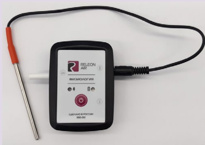
Рис. 12. Датчик температуры тела

Датчик температуры тела — предназначен для непрерывного измерения температуры тела в подмышечной впадине. Оснащён выносным зондом. Диапазон измерения: от 25 до 50 °С. Разрешение датчика: 0,1 °С. Технологическая особенность: для точного измерения в подмышечной впадине должна находиться вся металлическая часть зонда.